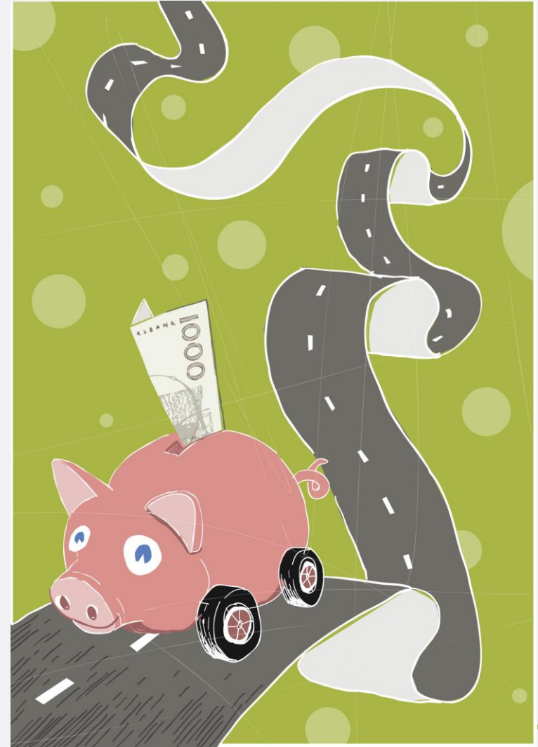
Illustration: Martin Wickström